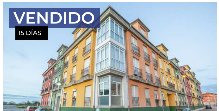
Piso en San Juan de la Arena