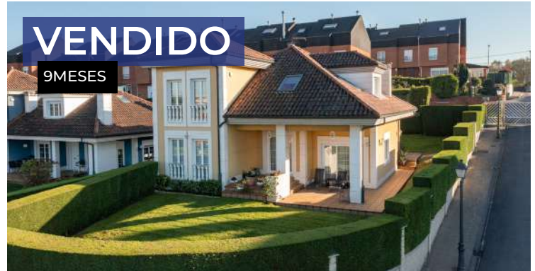
Chalet en Oviedo