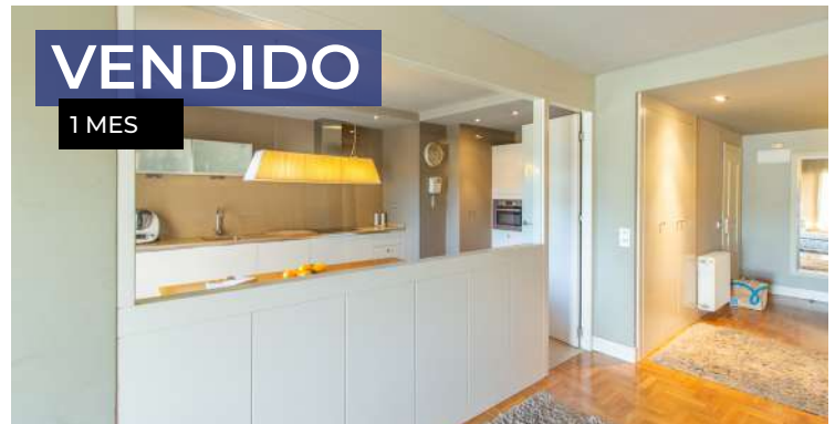
Piso en Oviedo, Montecerrao