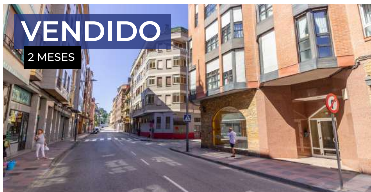
Piso en Mieres