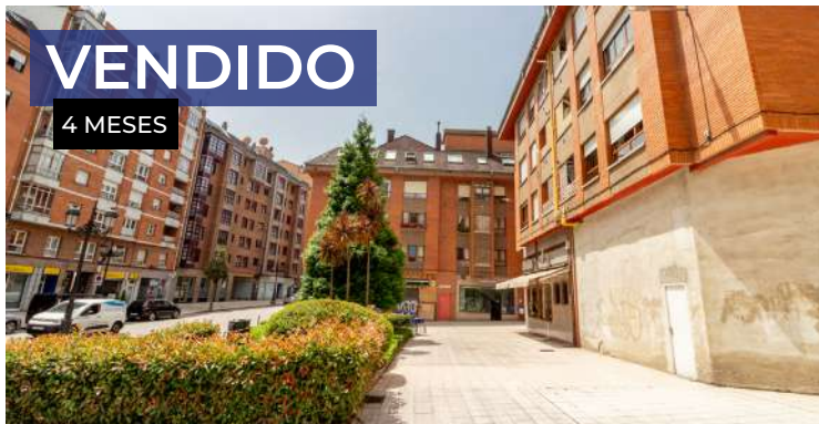
Piso en Oviedo, Pumarín