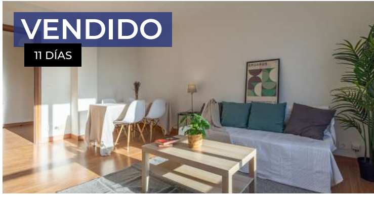
Piso en Gijón, zona Polígono